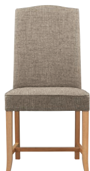
ヒストリアイスNA 11818-A D/布・ベベル1