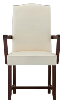
ヒストリアアームイスBR 11821-A