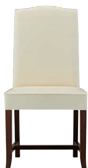
ヒストリアイスBR 11820-A D/レザー・レガートL-2554