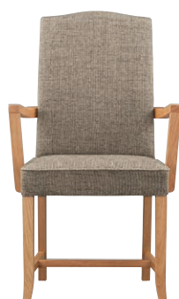
ヒストリアアームイスNA 11819-A