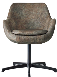
ブルーフェイスA 21774-A D/布・ロモン2 脚部：アルミ合金クロ塗装・AJ付 受座：回転式 ※受座に上下機能は、付属しません。