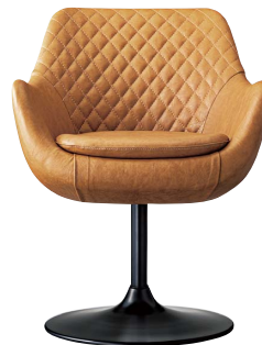
ブルーフェイスD 21836-A B/レザー・パロン01