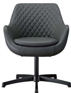
ブルーフェイスB 21775-A C/レザー・ゼラファイト・プロL-8099