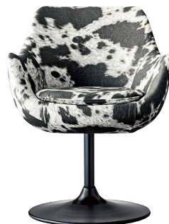
ブルーフェイスC 21835-A ランク外/レザー・ウィクリー1 ¥90,600 脚部：クロ塗装 受座：回転式 ※受座に上下機能は、付属しません。