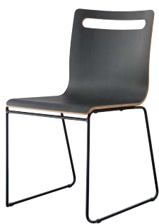
サーフィスB-BL2 21806-A 合板シート ¥42,800