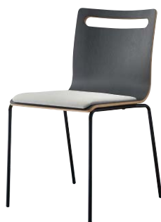
サーフィスC-BL2 21808-A C/レザー・ゼラファイト・プロL-6474