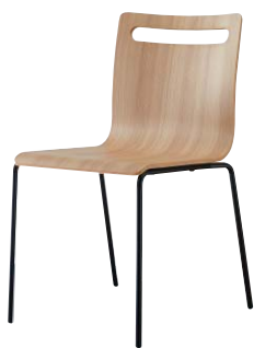
サーフィスA-BL1 21803-A 合板シート ¥41,800

時代に沿ったカラーコーディネート。 スタイリッシュな空間におすすめしたい一脚です。