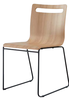
サーフィスB-BL1 21805-A 合板シート ¥42,800