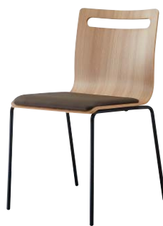
サーフィスC-BL1 21807-A C/レザー・ゼラファイト・プロL-6484