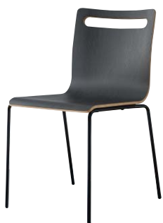
サーフィスA-BL2 21804-A 合板シート ¥41,800