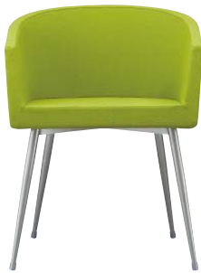
インクイスA-SG 21364-A E/布・パルパ031