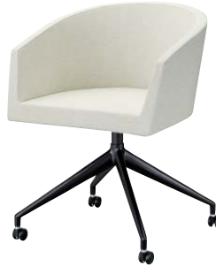
インクイスD (キャスター付) 21622-A D/レザー・フロワ1 脚部：ベースアルミ合金クロ塗装 (キャスター付) 座厚：55 受座：170角150ピッチ ※受座に上下・回転機能は、 付属しません。