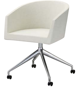
インクイスE (キャスター付) 21623-A D/レザー・フロワ1 脚部：ベースアルミ合金 (キャスター付) 座厚：55 受座：170角150ピッチ ※受座に上下・回転機能は、 付属しません。