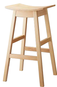
ジミースタンドNA 11927-E 合板シート ¥36,800

テイストを問わず使いやすいデザイン。 座面の仕様は、2パターンからお選びいただけます。