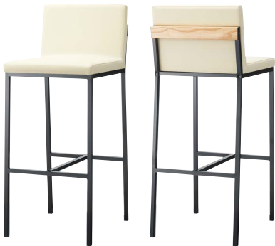
オーダースタンドBL1 21598-E C/レザー・セラファイト・プロL-8090