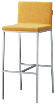
オーダースタンドAL2 21597-E F/布・パールT-9287

背裏に無垢材をあしらうシャープなデザイン。 単体での個性を望まない、 規則的なナチュラルテイストに最適です。 木部は装飾以外に、取手としてお使いいただけます。