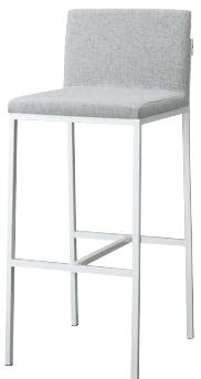
オーダースタンドWH1 21599-E C/布・クラックS-3