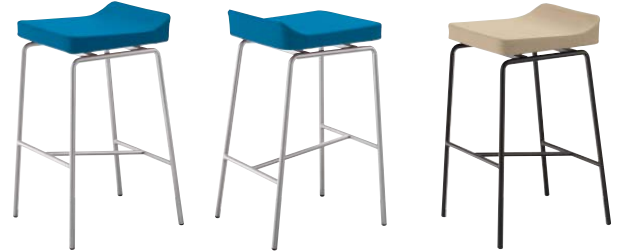
コンセスタンドA-AL 21378-E E/布・パルパ025