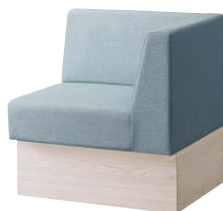
コンフル左アームWN1P W640 31320-5