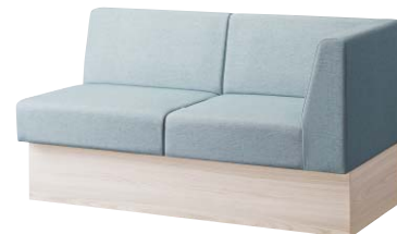
コンフル左アームWN2P W1240 31320-7