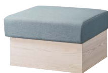
コンフルスツールWN W600 31320-9