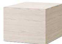
コンフルサイドテーブルWN W450 31320-M ¥59,800