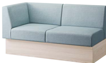
コンフル右アームWN2P W1240 31320-6