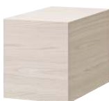
コンフルサイドテーブルWN W300 31320-S ¥49,800