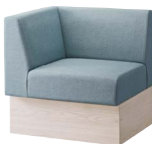
コンフル右アームWN1P W640 31320-4