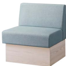
コンフルWN1P W600 31320-1 D/レザー・フロワ