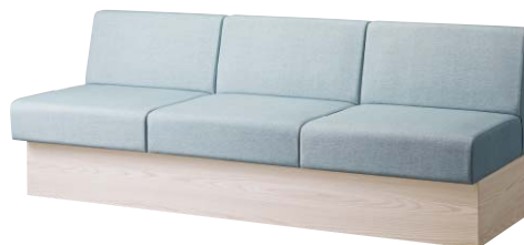
コンフルWN3P W1800 31320-3