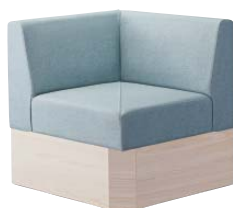
コンフルコーナー WN 31320-8