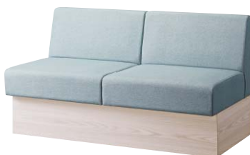
コンフルWN2P W1200 31320-2