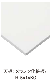
天板:メラミン化粧板/ H-5414KG