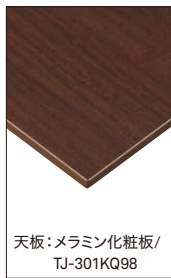
天板:メラミン化粧板/ TJ-301KQ98