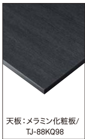
天板:メラミン化粧板/ TJ-88KQ98