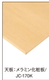
天板:メラミン化粧板/ JC-170K