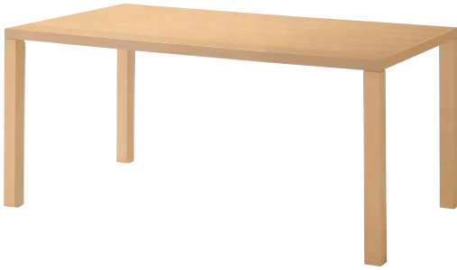
KT-720 (BR) 天板：突板/ブナ柾目 面材：突板/ブナ