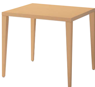
KT-721 (BR) 天板：突板/ブナ柾目 面材：突板/ブナ