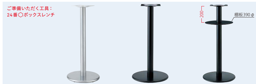
TABLE LEG ハイテーブル用

ベース:アルミ合金クロ塗装・AJ付 ポール:クロ塗装 (組立式) ベース:アルミ合金アルミ色塗装・AJ付 ポール:アルミ色塗装 (組立式)