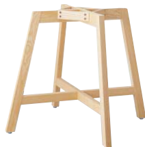
TABLE LEG 4本脚