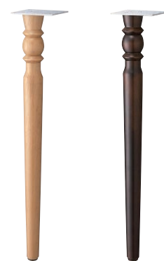
CT441-1 (NA) CT441-2 (BR)