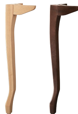
CT445-1 (NA) CT445-2 (BR)